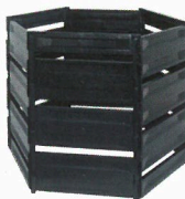
JRK Síla plastová