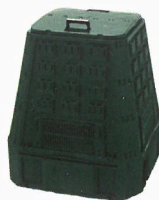
JRK Hobby kompostéry