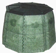
JRK Premium kompostéry