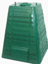
JRK Profi kompostéry