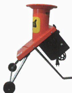
JRK Zahradní drtiče