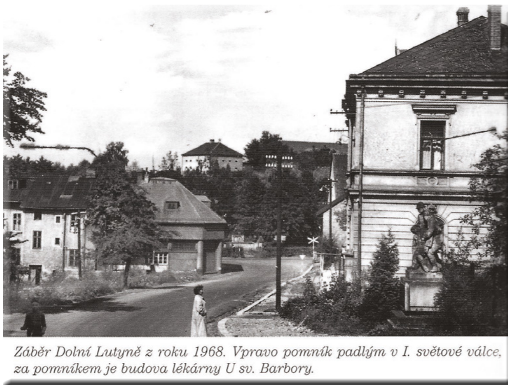
Záběr Dolní Lutyně z roku 1968. Vpravo pomník padlým v I. světové válce, za pomníkem je budova lékárny U sv. Barbory.

3) Název je odvozen od jména Leutherus, které bylo německými šlechtici ve středověku rozšířené. Všechny tyto vsi se stejně jako naše obec psaly německy „Leuthen“. V Braniborsku však také můžeme nalézt několik sídel s názvem Leuthen: Gross Leuthen na břehu stejnojmenného jezera, blízkou osadu Klein Leuthen, stejně jako o padesát