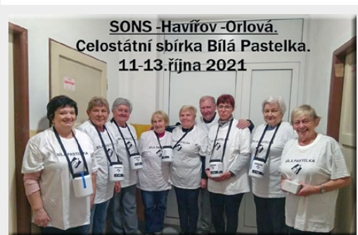
SONS - Havířov - Orlová. Celostátní sbírka Bílá Pastelka. 11-13. října 2021

Všem pozostalým vyjadřujeme upřímnou soustrast.