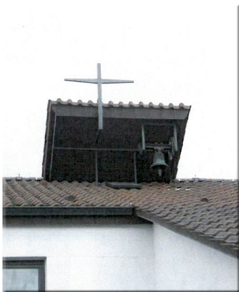
Dnes se zvon z Věřňovic nachází v kostele sv. Jiří v německém Hemmingenu

Tak jako se letos v říjnu vrátil do Píště na Opavsku kostelní zvon odvezený za 2. světové války nacisty do Německa, dočkají se navracení „vy-půjčených“ zvonů i v dalších farnostech ve Slezsku. Postupně by se zvony měly vrátit do Oldřišova a Třebomi na Opavsku, do Třanovic, Doubravy a Věřňovic. Kdy to ale bude, zatím nikdo nedokáže odhadnout.